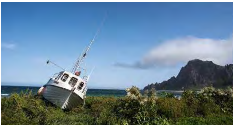
Prachtig zicht op een typisch vissersbootje in Bleik