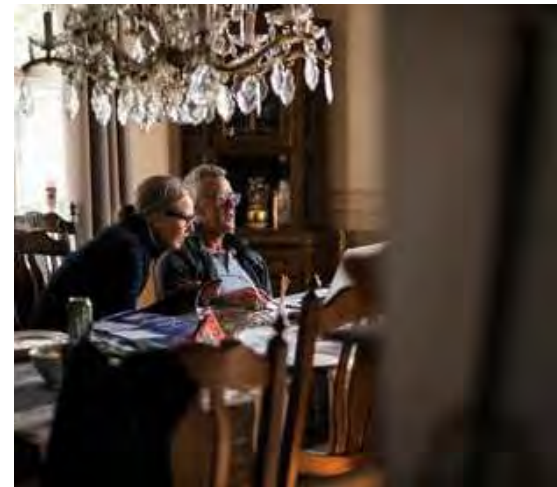
Overleg over de route in Villa Kakelbont

Een mooie laatste avond voor mij. Ik ga namelijk vanaf Tromsø weer huiswaarts, terwijl de rest van de groep nog doorgaat naar de Noordkaap. Als ik in het vliegtuig terug zit, kijk ik nog een keer vanuit vogelvlucht naar het prachtige landschap. Dag mooie ansichtkaart! 🐾