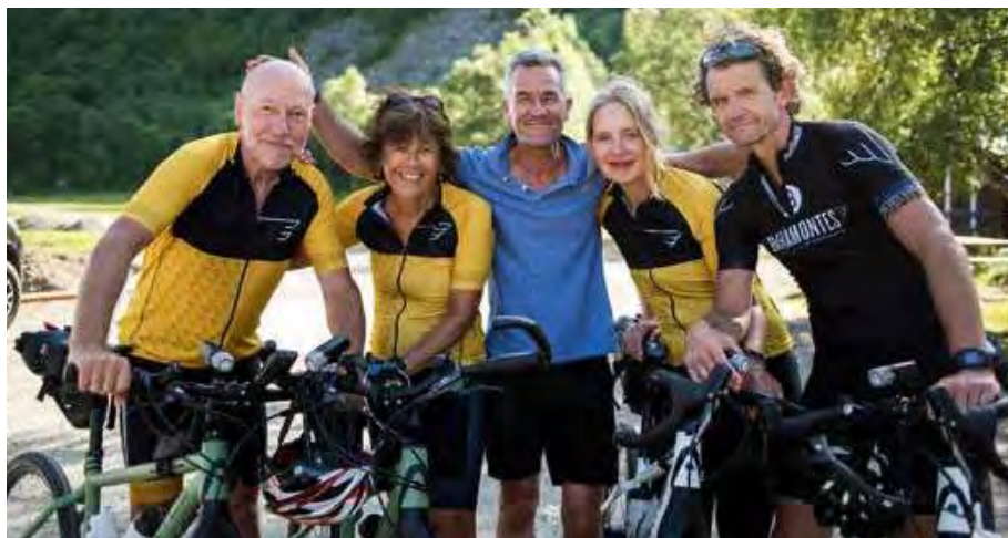
De hele groep na aankomst op de camping in het bos