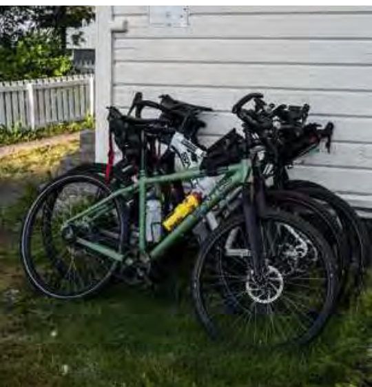
De Santos-fietsen mogen ook even uitrusten