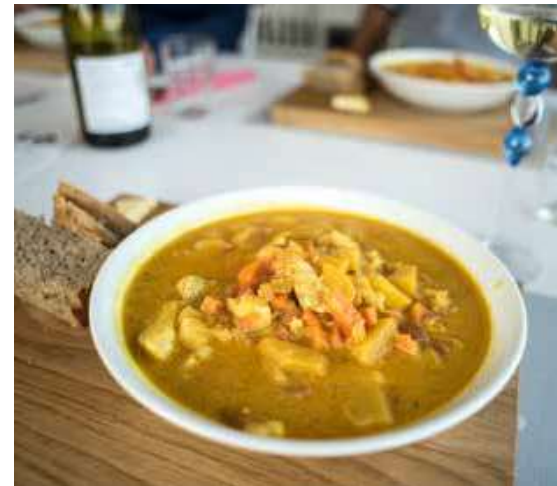
Het is goed toeven bij Yggdrasiltunet Farm Hotel