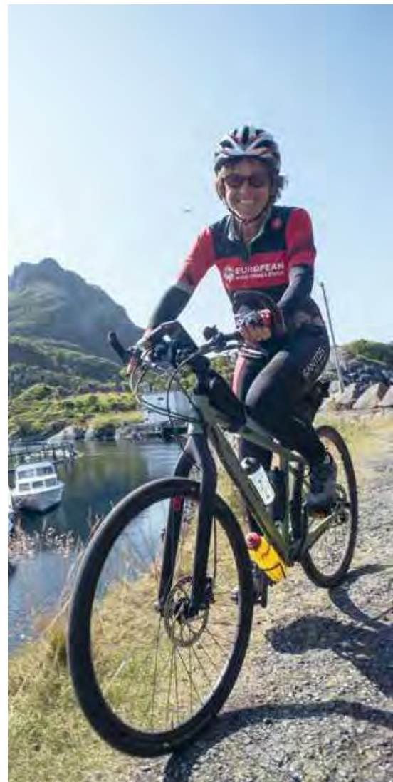
Na de ferry snel weer op de fiets