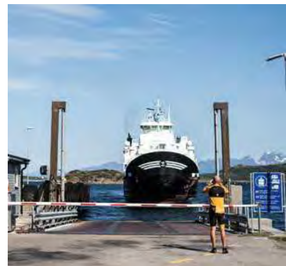
Fotootje maken bij de ferry én rust voor de benen