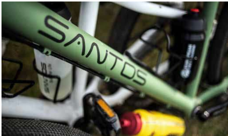
De deelnemers fietsen op Santos-fietsen die tijdens de reis regelmatig gecheckt worden