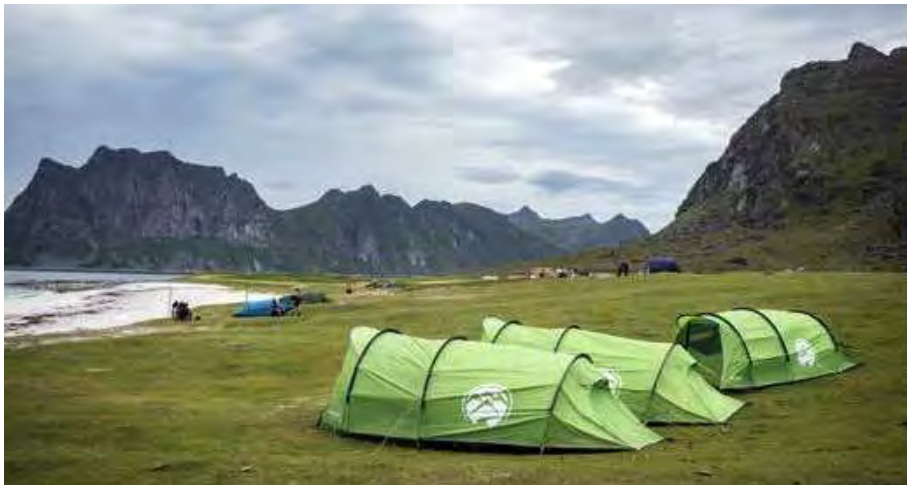
De tentjes van European Bike Challenge staan klaar op het Uttakleiv-strand

Na een eerste nacht in de camper in Saltstraumen is het weer een zonnige ochtend en pakken we de ferry bij Bodø naar Moskenes, zo'n vier uur lang op het water. Een goede manier om iedereen te leren kennen. We zien wel wat wolkjes boven het gebied waar we naartoe varen, dus we bereiden ons voor op wat slechter weer. Na de overtocht