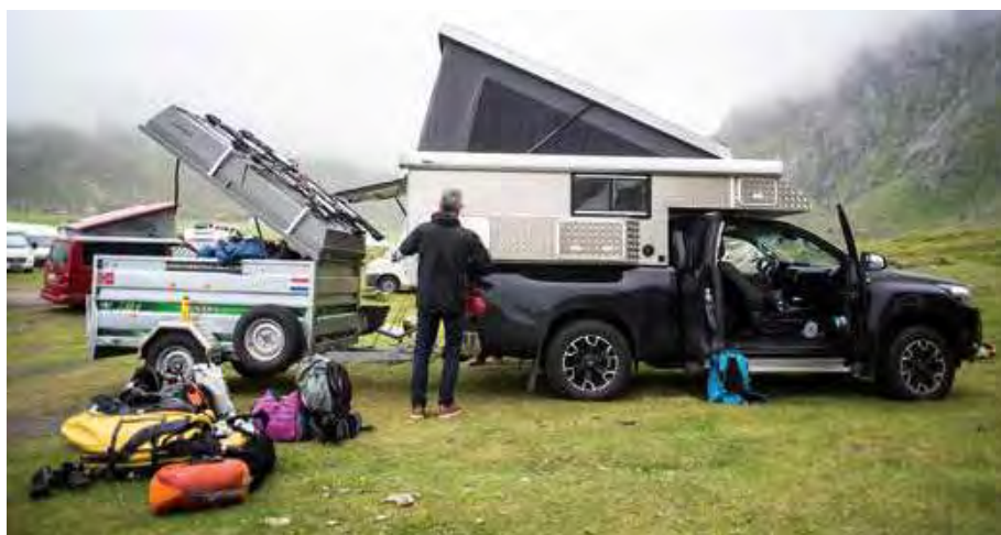
Na het vertrek van de fietsers wordt de expeditiecamper ingepakt, altijd een nauwkeurig karwei

springen de deelnemers weer op hun mooie fietsen, klaar voor een zeventig kilometer lange tocht naar Utrakleiv. Daar komen wij als basecamp iets eerder aan. Nadat de tentjes zijn opgezet komen de deelnemers aan, ze hebben flinke wind tegen gehad. Na een Adventure Food-maaltijd en gezelligheid van de borrelaars onder de luifel van de camper, genieten we van een prachtige zonsondergang die een eeuwigheid lijkt te duren.