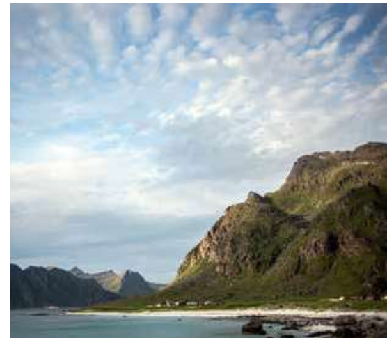
Alleen maar prachtig landschap om ons heen