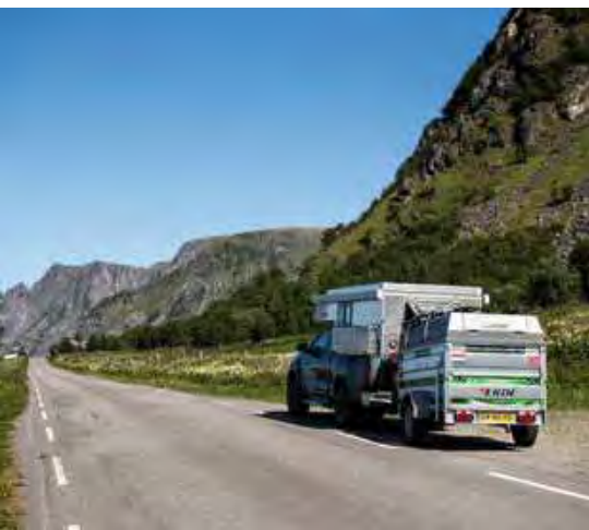
Het landschap is één grote ansichtkaart

De volgende dag vertrekken we naar het hotelletje, een stukje verderop. Het ligt prachtig. We maken nog een wandeling. Die wind blaast je helemaal 'moe', die constante ruis om je hoofd, het is een bijzondere ervaring. We kijken vanaf het hotelletje uit op een papegaai-duiker-eiland. Tien kilometer naar Andenes, dat is eigenlijk 'het enige' wat gefietst moet worden op de 'rustdag'. Dat blijkt echter onmogelijk, want de fietsers worden omvergeblazen. Uiteindelijk gaan twee fietsers op de aanhanger van de camper, en twee fietsen achterop de lokale bus richting Andenes. Wat een wind.