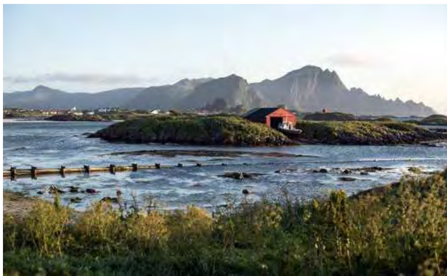
Een van de vele fraaie landschappen die worden gepasseerd